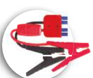
PINZAS DE ARRANQUE 12V / 24V